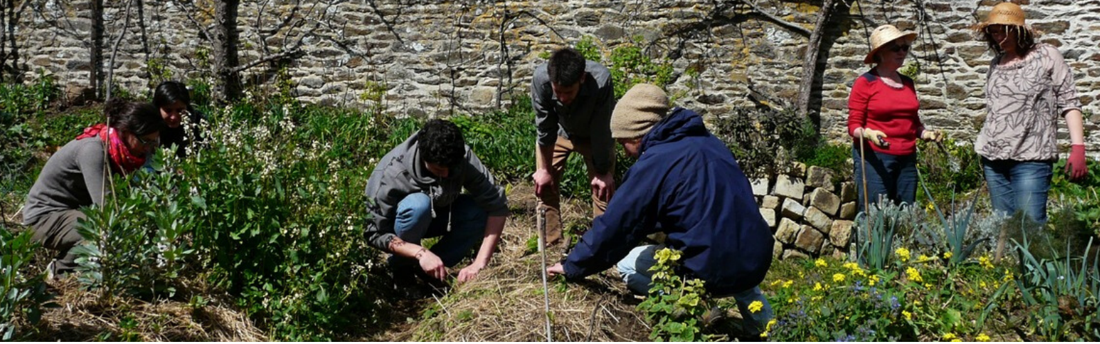
Le Jardin Capucine, rempart de biodiversité